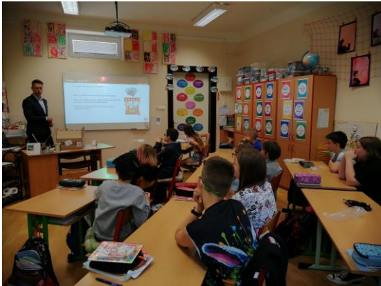
Beseda o finanční gramotnosti