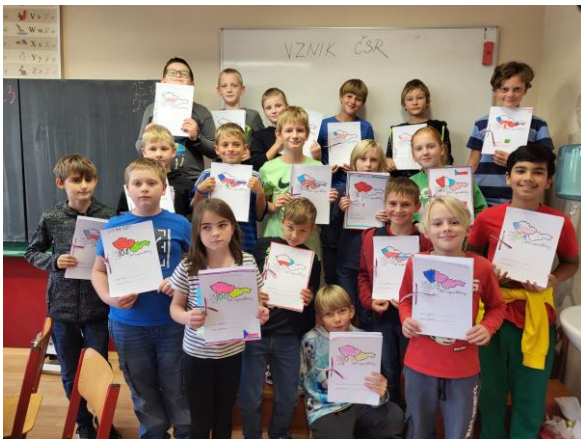
Projektový den ke vzniku ČR

Dne 25.10. měla 3. a 4. třída projektový den ke vzniku Československa. Děti na stanovištích plnily připravené úkoly, z nichž si po úspěšném splnění vytvořily lapbook, věnovaný právě Československu.