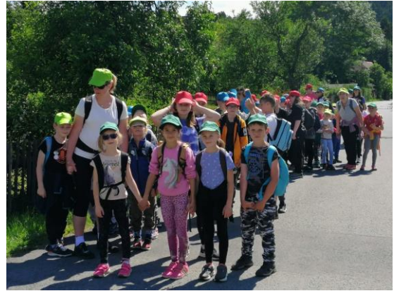
Na výletě do Sloupu