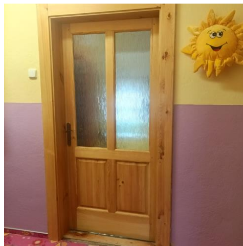
Nové dveře a obložky zárubní v Kořatech

Ve Sluníčkách mají v jedné místnosti také nový koberec.