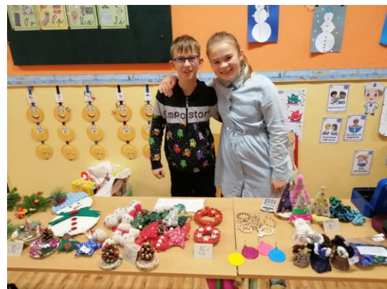
Přípravy na vánoční jarmark