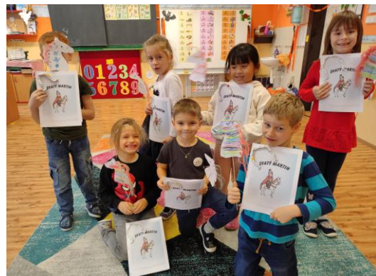
Projektový den sv. Martin

2.11. jsme měli ve škole další projektový den Halloween - Dušičky, kde jsme si povídali o těchto svátcích, jak se kde slaví, děti plnily různé úkoly a na závěr si vydlabaly strašidelné dýně, které pak zdobily hlavní vchod školy. Desátý listopad patřil v 1. třídě projektovému dni o svatém Martinovi. Děti se seznámily s legendou a tradicemi, které si potom různými činnostmi upevnily.