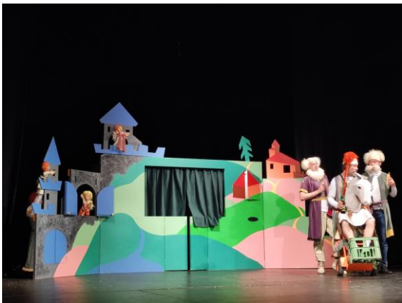
Staré pověsti české v divadle v Děčíně

V lednu jsme navštívili divadlo v Děčíně a divadlo Matýsek přijelo za námi do školy.