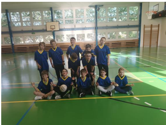
Naši reprezentanti ve vybíjené

V dubnu jsme soutěžili mezi školami ve vybíjené a fotbale. Ve vybíjené jsme obsadili 7. místo mezi silnou konkurencí úplných děčínských škol. Ve fotbale se našim chlapcům podařilo opět vyhrát okresní kolo málotřídních škol a postoupili do krajského kola soutěže McDonald's Cupu v Teplicích, kde nakonec po bojovném výkonu skončili na sedmém místě.