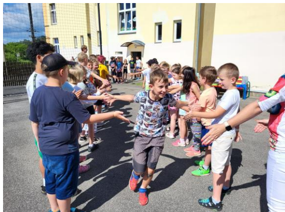
Loučení s pátáky

Na konci školního roku jsme se slavnostně rozloučili s našimi pátáky.