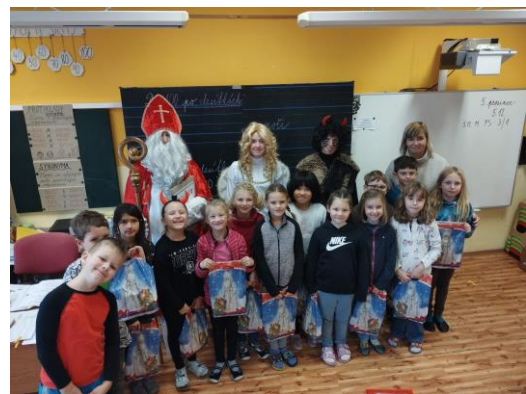
Mikuláš u druháků