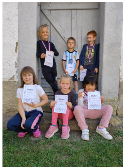
Prvňáci na Branném závode

V říjnu jeli třetíci, čtvrťáci a pátáci do knihovny v Děčíně na besedu o knížce, kterou si zapůjčili do školy pro společné čtení. V tomto měsíci jsme také začali každé úterý jezdit do Děčína na kurz bruslení, kde děti učili bruslit trenéři HC Děčín. Všechny děti se bruslit naučily a bruslení se jim moc líbilo.