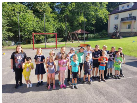
Prvňáci se svými pátáky

Koncem září jsme uspořádali Branný závod hlídek, kde si všichni prověřili své znalosti o přírodě a svou obratnost. Také nás ve škole navštívilo kytarové duo Guitar Arte z České Kamenice se svým hudebním vystoupením Křížem krážem.