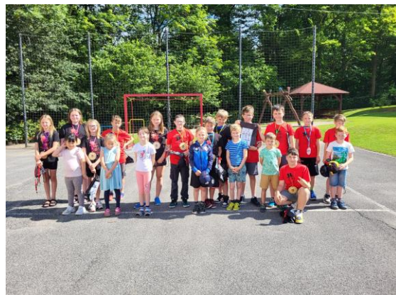
Malý velký kamarád

Pátákům jsme popřáli hodně úspěchů na nové škole ☺.