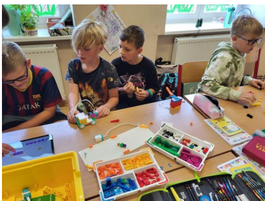
Práce s legem

Při vyučování i mimo něj využíváme ICT techniku.