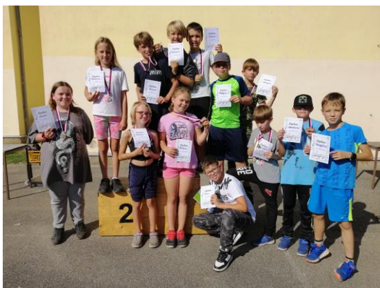
Vyhodnocení Branného závodu

Koncem září jsme uspořádali Branný závod hlídek, kde si všichni prověřili své znalosti o přírodě a svou obratnost. Také nás ve škole navštívilo kytarové duo Guitar Arte z České Kamenice se svým hudebním vystoupením Křížem krážem.