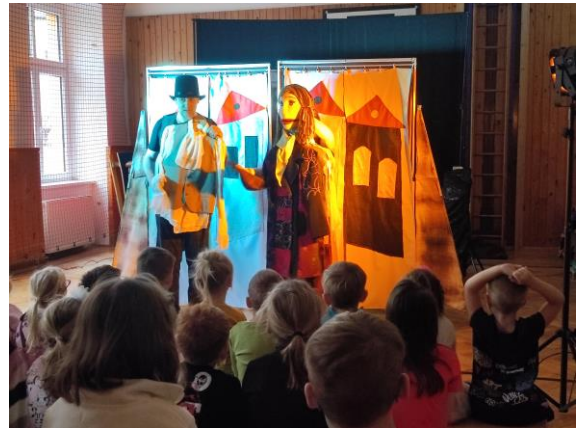
Divadlo Matýsek ve škole

V únoru k nám přijel příslušník Policie ČR, aby s dětmi pohovořil na téma nebezpečí na internetu.