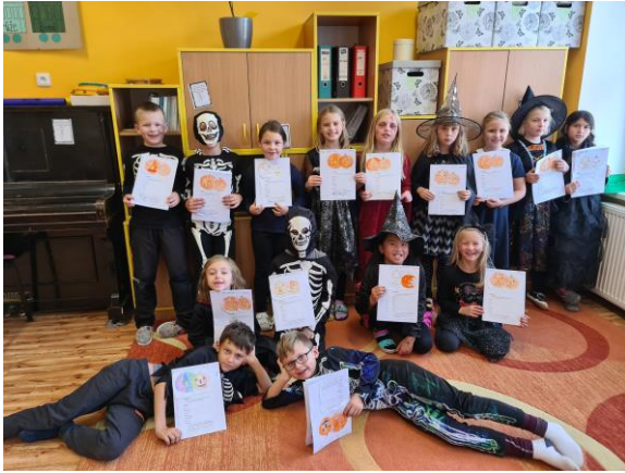
Druháci a Halloween