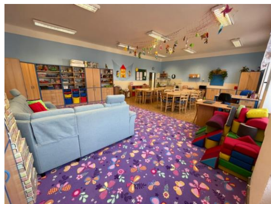
Nově vymalovaná a nově uspořádaná školní družina s novým kobercem 😊

Velké poděkování patří panu Hajdinovi, který vyrobil v MŠ Kořata do 1. poschodí patery nové dveře včetně obložek na zárubně.