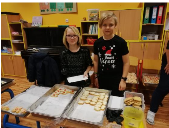
„Bufet“ na vánočním jarmarku