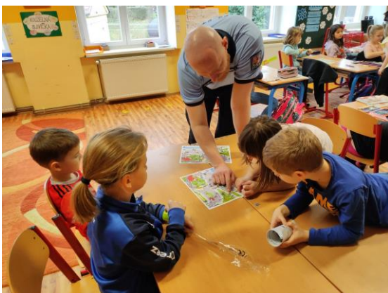
Beseda s policií

V únoru k nám přijel příslušník Policie ČR, aby s dětmi pohovořil na téma nebezpečí na internetu.