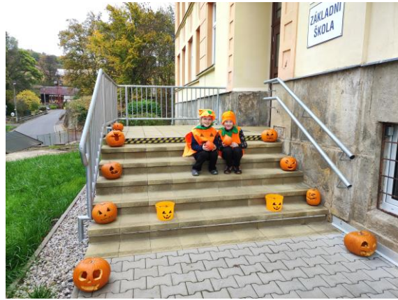
Výzdoba před školou

V prosinci jsme se těšili na vánoce a krásný adventní čas. Prvňáci navštívili děčínský zámek, do školy přišel Mikuláš s čertem a andělem, také jsme uspořádali pro všechny rodiče a příznivce školy vánoční jarmark, který jsme si moc užili a na samém konci měsíce jsme měli projektový den o vánočních tradicích.