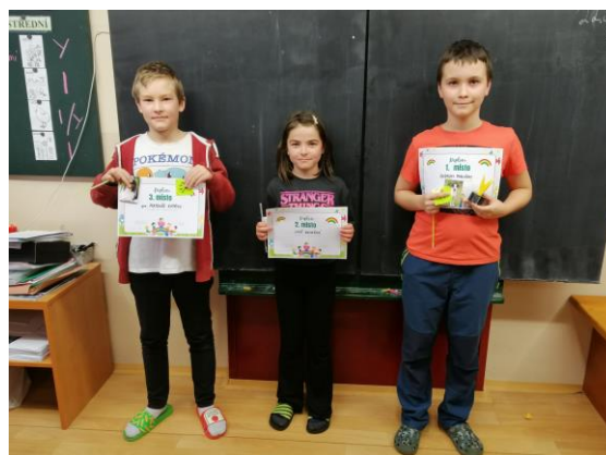
Žáci 4. a 5. ročníku

Při vyučování i mimo něj využíváme ICT techniku.