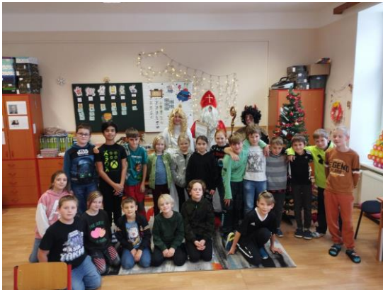
Mikuláš u žáků 3. + 4. ročníku

V prosinci jsme se těšili na vánoce a krásný adventní čas. Prvňáci navštívili děčínský zámek, do školy přišel Mikuláš s čertem a andělem, také jsme uspořádali pro všechny rodiče a příznivce školy vánoční jarmark, který jsme si moc užili a na samém konci měsíce jsme měli projektový den o vánočních tradicích.