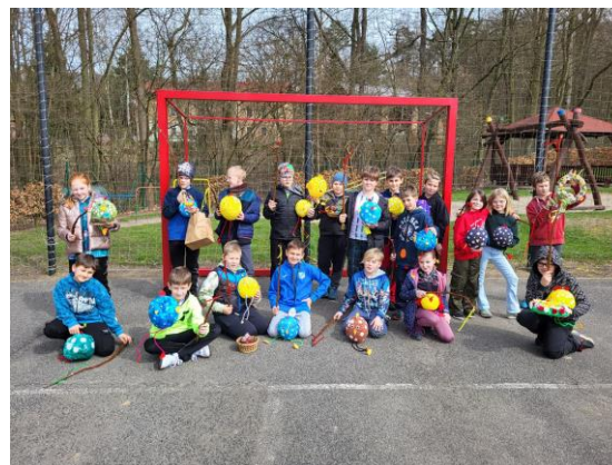
Velikonoce ve škole

Na začátku dubna k nám přijelo Sférické kino, kde si každá třída mohla vybrat naučný film. Naše škola se také zapojila k mezinárodnímu dni Země. Ve spolupráci s obecním úřadem v Ludvíkovicích jsme pomohli obnovit část obecního lesa. Po záslužné práci si děti opekly