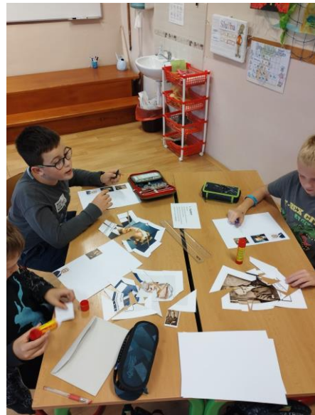
Práce ve skupinách

2.11. jsme měli ve škole další projektový den Halloween - Dušičky, kde jsme si povídali o těchto svátcích, jak se kde slaví, děti plnily různé úkoly a na závěr si vydlabaly strašidelné dýně, které pak zdobily hlavní vchod školy. Desátý listopad patřil v 1. třídě projektovému dni o svatém Martinovi. Děti se seznámily s legendou a tradicemi, které si potom různými činnostmi upevnily.