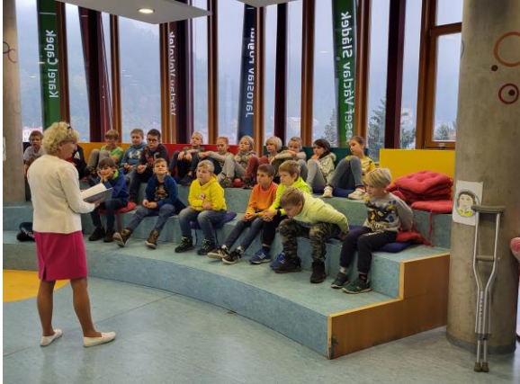
Třetřáci se čtvrťáky v knihovně