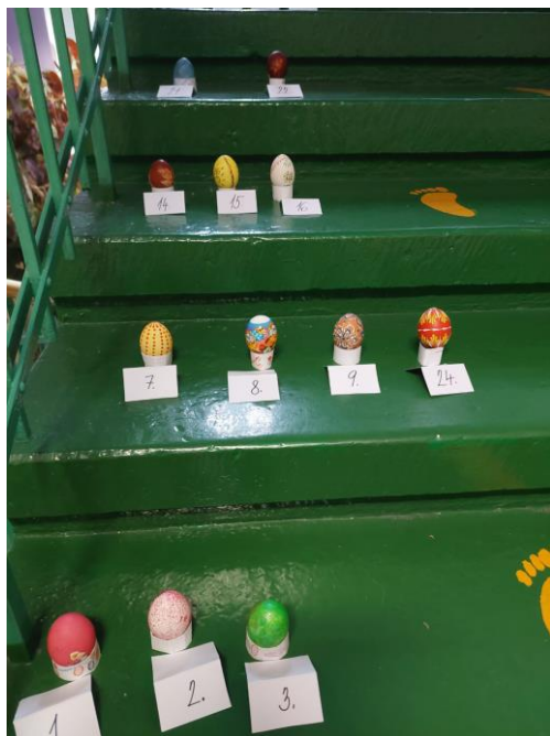
Soutěž o nejkrásnější velikonoční vajíčko