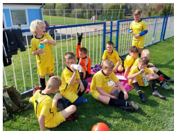
Nejmladší fotbalisté na McDonalds' Cupu