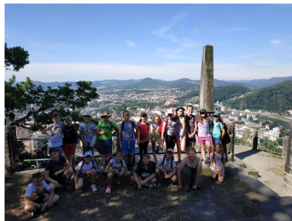
Na Kvádrberku – druháci s bývalými spolužáky a čtvrtřáci