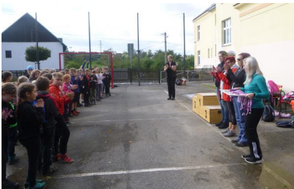
Vyhodnocení Branného závodu