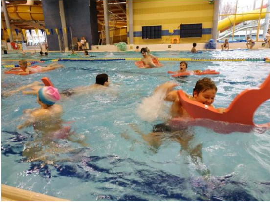
Plavecký kurz v Děčíně

Od listopadu do února jezdili druháci až pátáci na plavecký kurz do Děčína.