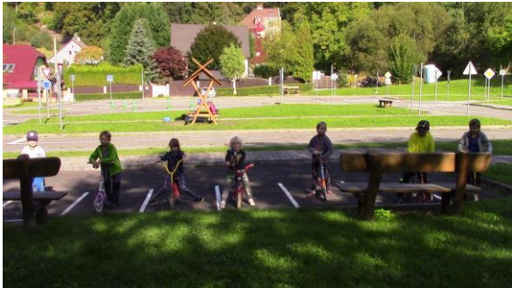
Prvňáci na dopravním hřišti

Na začátku školního roku jsme slavnostně přivítali prvňáčky, uspořádali jsme pro děti Branný závod, přijelo k nám divadlo Matýsek s představením Břichbulín. Navštívili jsme několikrát knihovnu v Děčíně nebo muzeum s výstavou betlémů, prvňáci byli v mýdlárně Rubens v Růžové a na dopravním hřišti v Děčíně.