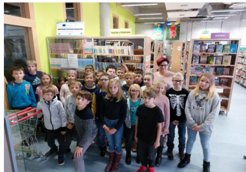
3. + 5. ročník