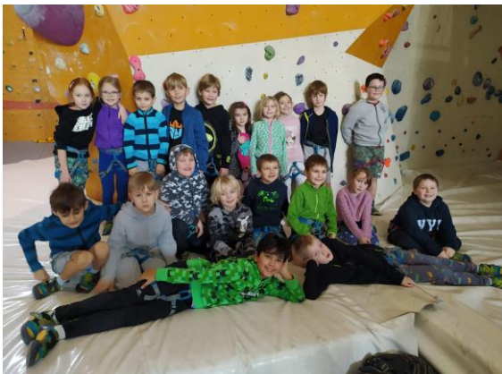
Horolezecká stěna v Ústí n/L

V únoru byli prvňáci s druháky v Ústí n/L na horolezecké stěně a také v teplickém planetáriu a hvězdárně, v březnu jsme navštívili divadlo v Děčíně na představení Staré pověsti české.