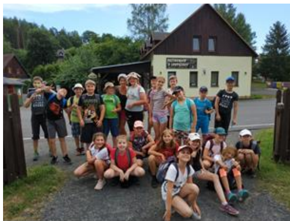
Čtvrtáci na ŠvP