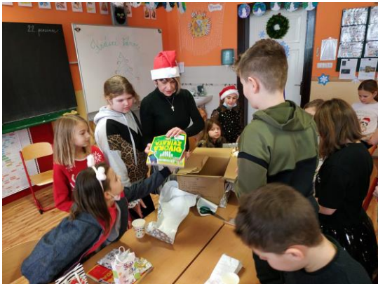
Vánoce u čtvrtáků

Začátkem prosince však přišel čert s Mikulášem a andělem, děti si rozdaly dárečky u třídních vánočních stromečků.