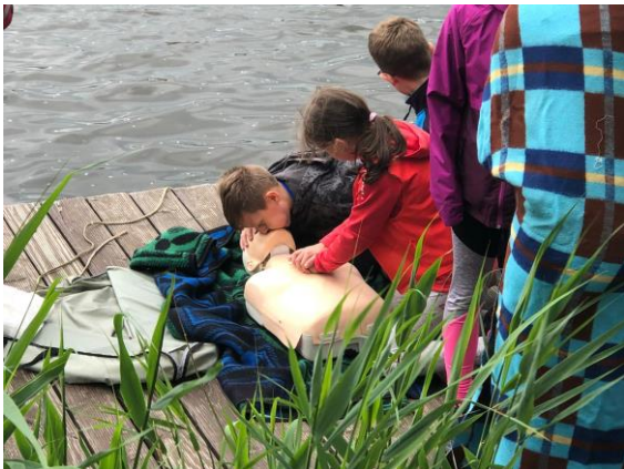
Soutěž Mladý zdravotník

V dubnu jsme měli celoškolskou soutěž o nejkrásnější velikonoční vajíčko. Třetíci, čtvrtáci a pátáci navštívili děčínský zámek s programem Mozkohrátky. V tomto měsíci se také naši malí fotbalisté zúčastnili fotbalového turnaje McDonalds' Cup v Markvarticích, kde skončili na sedmém místě. Letos poprvé se zúčastnili někteří třetíci, čtvrtáci a pátáci soutěže Mladý zdravotník a obsadili skvěle první místo v okrskovém kole a postoupili do regionálního kola, kde se umístili na nádherném třetím místě. Na konci dubna se slétly všechny školní čarodějnice na ludvíkovickém fotbalovém hřišti, kde jsme pro děti připravili spoustu soutěží spolu s opékáním buřtíků.