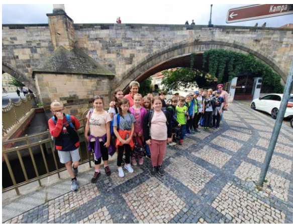
Třetřáci a páťáci v Praze

V tomto měsíci také proběhly školní výlety. Třetřáci s páťáky navštívili historickou Prahu, a spolu s druháky ZOO, prvňáci byli na koních, všechny třídy pak byly tradičně na Kvádrberku, kde se potkaly se svými bývalými spolužáky.