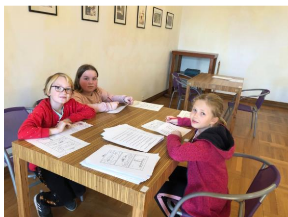
Mozkohrátky na zámku v Děčíně - třetíci