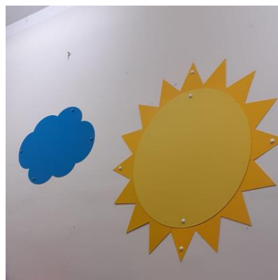
Nové magnetické nástěnky ve Sluníčkách