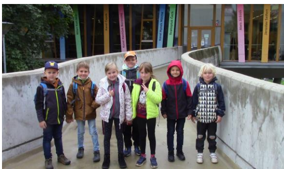
V knihovně 1. ročník