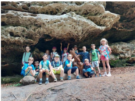
Druháci na ŠvP

Koncem června vyjeli druháci a čtvrtáci na třídní „školu v přírodě“ do Vysoké Lípy, kde si užili spoustu skvělých zážitků spolu s vyhodnocením celoroční třídní hry.