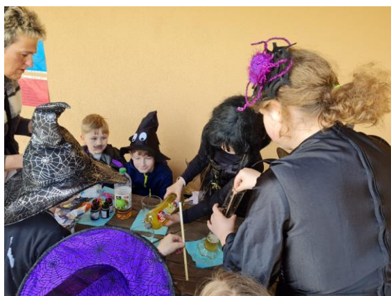
Čarodějnice na fotbalové hřišti