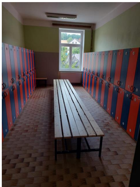
Naše nová šatna