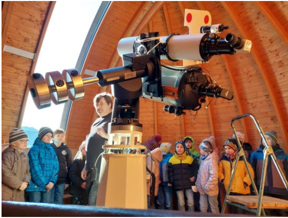
Hvězdárna v Teplicích